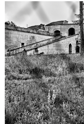
Der kopflose Gott Idylle am Karlsgraben